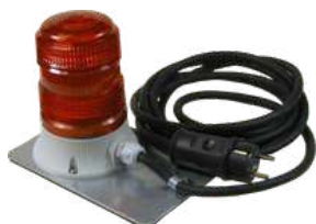
Luz de señalización