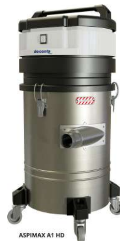
ASPIMAX A1 HD

Aspiradora diseñada para la recogida de polvo fino peligroso, especialmente amianto. Equipada con motor by-pass, sistema semiautomático de limpieza del filtro con mando. Filtro H13. Bastidor de acero, capacidad del depósito: 25 L. Peso: 22 Kg.