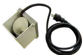
Sirena de alarma

S3 está equipado con alarma remota GPS, impresora, transferencia de datos vía USB, y 5 canales de entrada adicionales para sirena, señal luminosa, extractor de emergencia, etc.